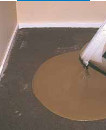
Aplicarea de Novoplan 21 pe substrat

Indicatiile si prescriptiile de mai sus, desi corespund celei mai bune experiente a noastre se vor considera, in orice caz, cu caracter pur orientativ si vor trebui sa fie confirmate de aplicatii practice care inlatura orice indoiala; de aceea, inainte de a adopta produsul, cel care intentioneaza sa-l foloseasca trebuie sa stabileasca el insusi daca produsul este sau nu adecvat utilizarii avute in vedere, si oricum sa-si asume intreaga raspundere ce poate deriva din folosirea lui.