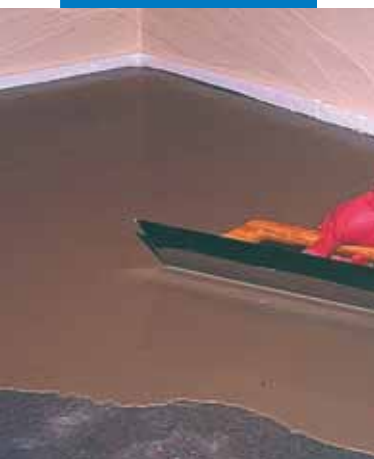
Aplicarea de Novoplan 21 pe o sapa din ciment folosind spatula metalica