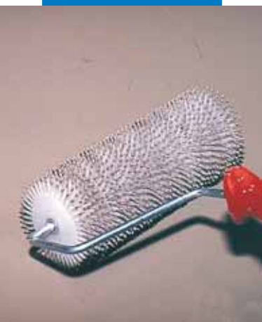
Eliminarea bulelor de aer din sapa proaspata Novoplan 21 cu ajutorul rolei cu tepi

Referintele cu privire la aceste produse sunt disponibile la cerere sau pe www.mapei.ro si www.mapei.com